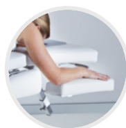
SUPPORTS DE BRAS