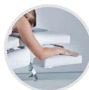
SUPPORTS DE BRAS