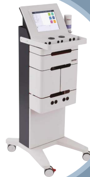
Combi 400 VIP